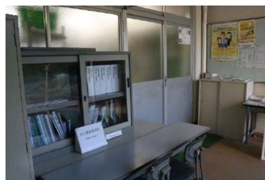
就職指導室 (第2教棟1F)