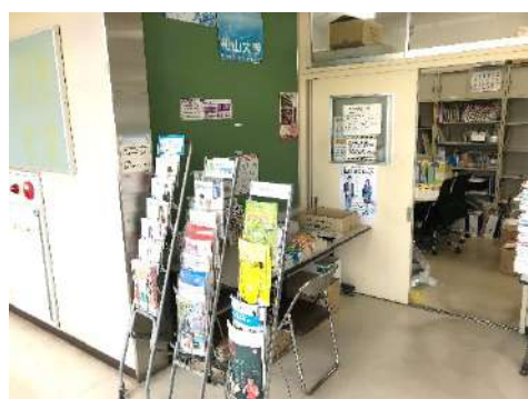
進学指導室 (第3教棟3F)